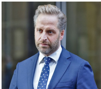
Minister de Jonge

Minister De Jonge voor wonen heeft medio mei zijn plannen bekendgemaakt om meer mensen aan een betaalbare woning te helpen.