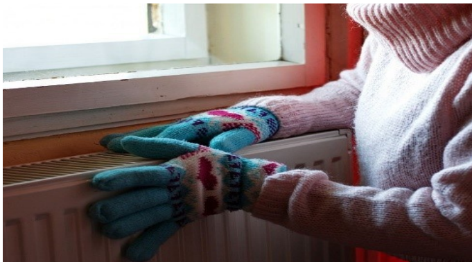
Sommige huurders dragen mutsen en wanten in huis om warm te blijven

Veel huurders komen in grote problemen door de grote stijging van de energieprijzen. Ruim een half miljoen Nederlanders leeft al in energiearmoede. 87% van hen is huurder. Het aantal bewoners, vaak huurders, dat in energiearmoede leeft, gaat de komende maanden toenemen door de hoge prijs van gas, warmte en stroom. Daarom heeft de Woonbond het Meldpunt Energiealarm geopend. Ook start de Woonbond de campagne 'Haal energie uit je rekening'. Huurders in Geleen die worstelen met hun energierekening, adviseren we hiervan gebruik te maken.